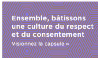
Capsule « Ensemble, bâtissons une culture du respect et du consentement »