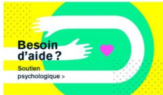
Ressources en santé globale