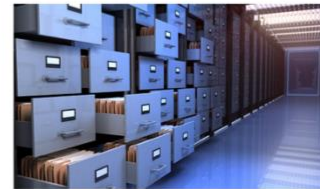
Dossier des membres du personnel : vers le numérique