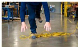
Formulaire de déclaration d'accident du travail