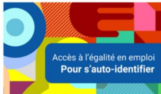
Accès à l'égalité en emploi: Pour s'auto-identifier