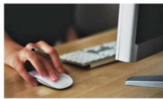
Centre de demandes RH